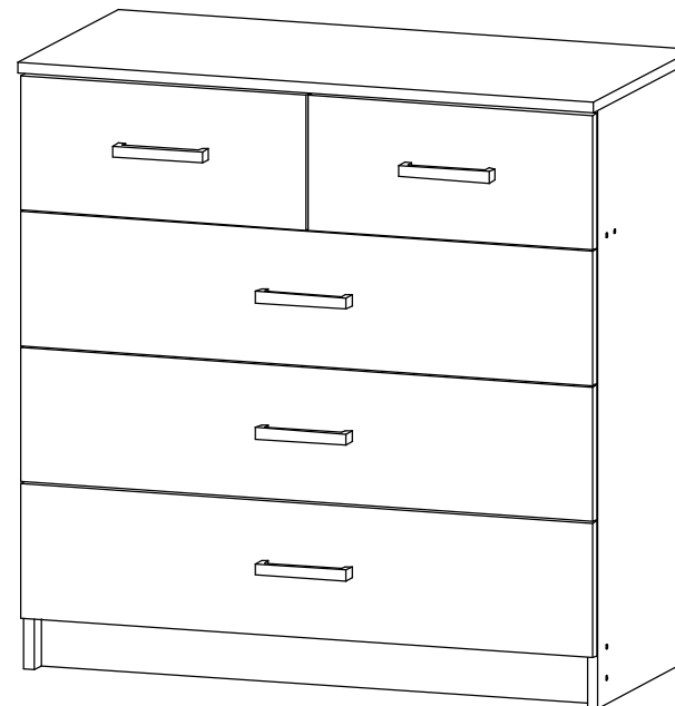
Вега К-04 (Комод 5/2 ящ.)

Уважаемые покупатели, рекомендуем доверить сборку Вашей мебели профессиональным сборщикам